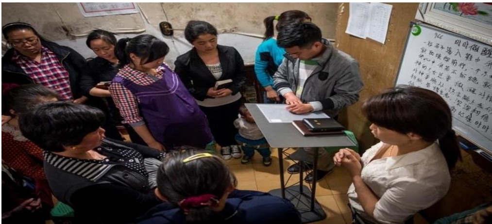
आधुनिक हाउस चर्च,आधुनिक काळात सर्वसाधारणपणे घरा-घरात-आळीपाळीने आठवड्यात भक्तीफेरी घेतली जाते. कथीडल/ बेसिलिका :-