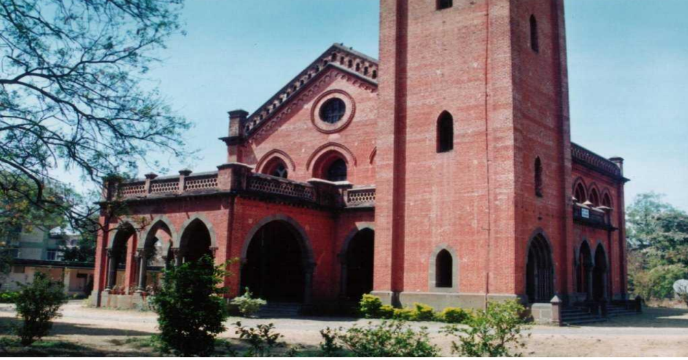
१८६३ ला स्थापन झालेले पुण्यातील सर्वात जुने सिनेगोज,डेविड सिनेगोज

झाले.तरीही अनेक यहुदी हे भारतात वास्तव्यास आहे.