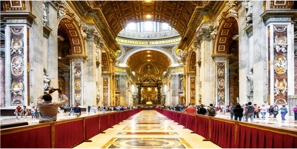
सेंट पीटर्सबर्ग चर्च, रोम.