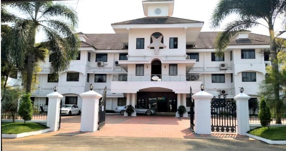
जेकॉबिट सिरीयन ओर्थोडोक्स चर्च,कोची,केरला