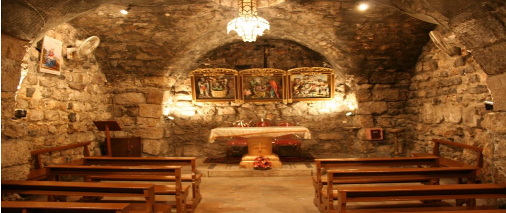
जुन्या काळातील हाउस चर्च एका दगडाचा लेणीत कोरलेले आपण पाहतो.

सेंट ऑगस्टीन म्हणतात "चर्च म्हणजे स्वर्गाचे पृथ्वीवरील स्वरूप" हाउस चर्चच्या माध्यमातून चर्चची सुरुवात झाली .सुरुवातीच्या काळात जेव्हा ख्रिस्ती लोकावर छळ होत होता.तेव्हा त्यांनी हाउस चर्चसची स्थापना करून घरोघरी आळीपाळीने भक्तीफेऱ्या करू लागले.आणि येथूनच स्थानिक आणि हाउस चर्च चा विकास घडून आला.